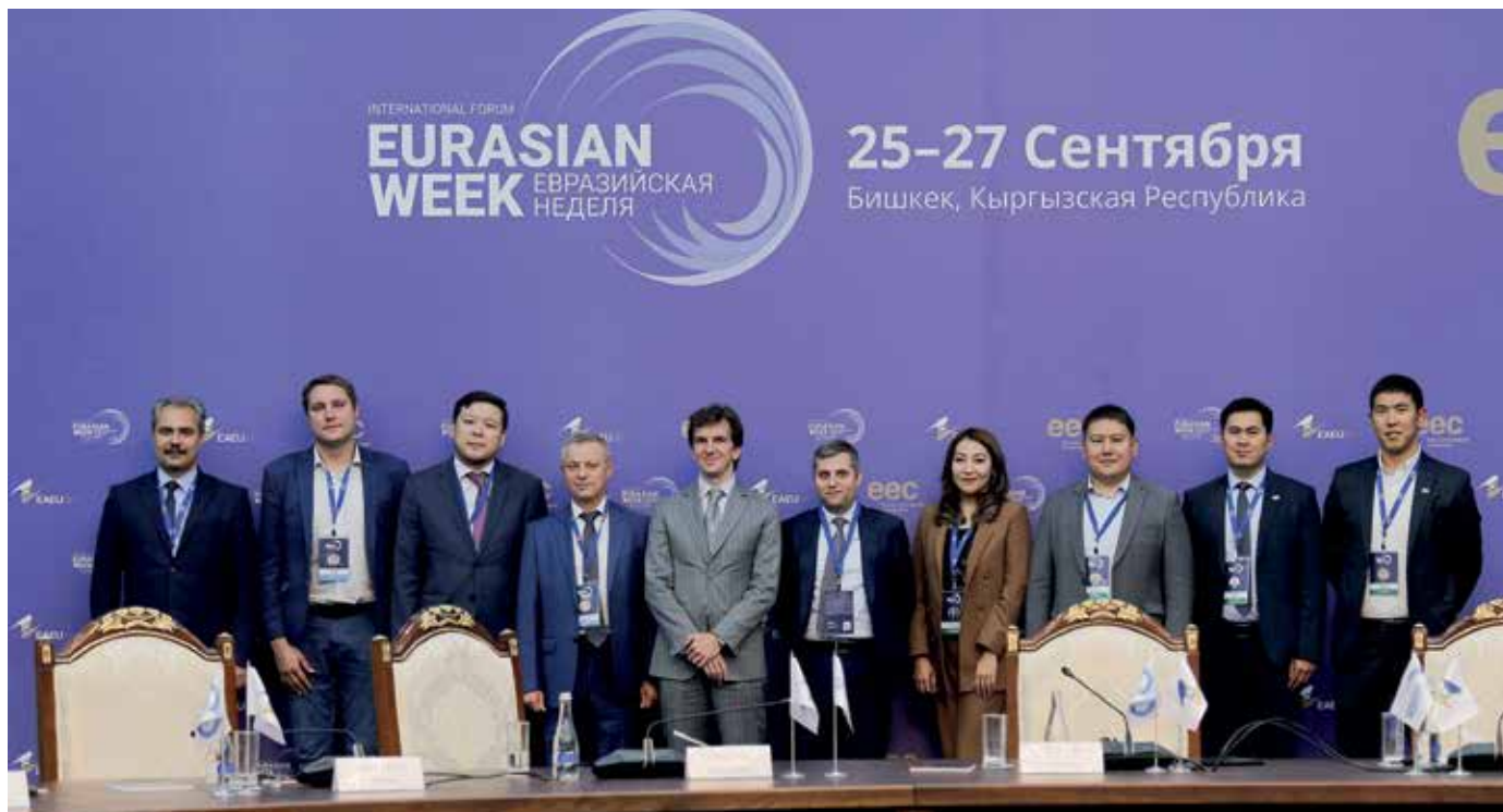
Международный форум «Евразийская неделя – 2019»: встреча глав экспортных кредитных агентств стран – членов ЕАЭС. Бишкек (Республика Кыргызстан), 25-27 сентября 2019 года

Полномасштабная и целенаправленная работа национальной системы поддержки экспорта, включая уже созданный «Белэксимгарант», началась с принятием Указа Президента Республики Беларусь от 25 августа 2006 года № 534 «О содействии развитию экспорта товаров (работ, услуг)», в соответствии с которым создана национальная комплексная система стимулирования экспорта, включающая совокупность механизмов финансирования и страхования внешне-торговых операций от политических и коммерческих рисков.